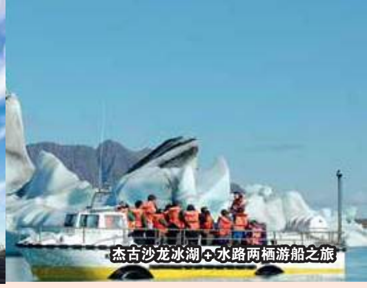
杰古沙龙冰湖 + 水路两栖游船之旅