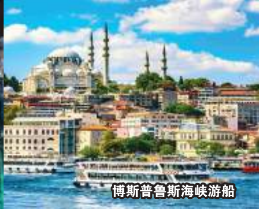
博斯普鲁斯海峡游船