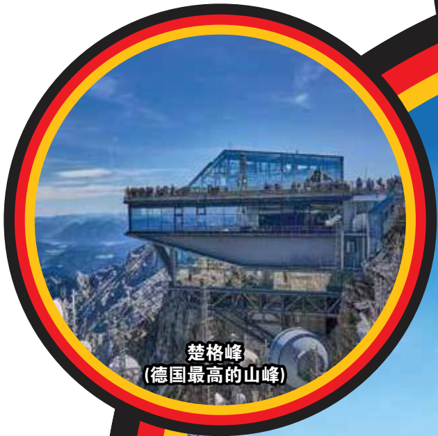
楚格峰 (德国最高的山峰)