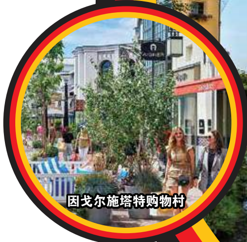
因戈尔施塔特购物村