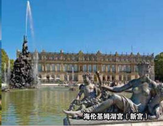
海伦基姆湖宫（新宫）