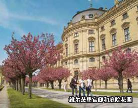
维尔茨堡官邸和庭院花园