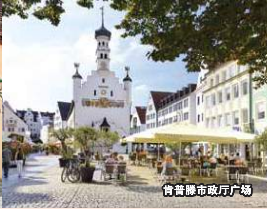
肯普滕市政厅广场