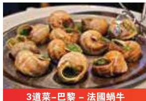
3道菜-巴黎 - 法國蝸牛