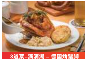
3道菜-滴滴湖 - 德国烤猪脚