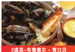
3道菜-布鲁塞尔 - 青口贝