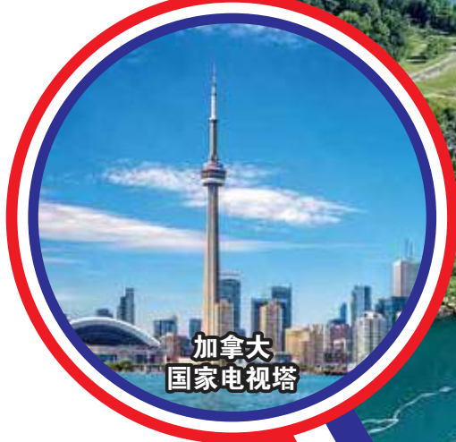
加拿大 国家电视塔