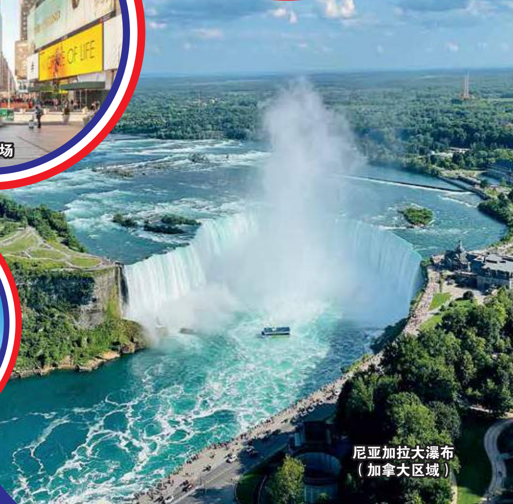
尼亚加拉大瀑布 (加拿大区域)