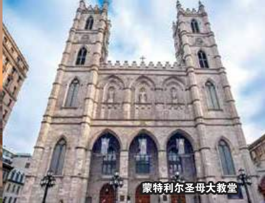
蒙特利尔圣母大教堂