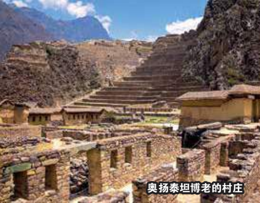
奥扬泰坦博老的村庄