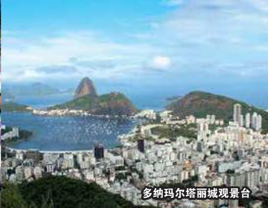
多纳玛尔塔丽城观景台