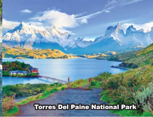
Torres Del Paine National Park