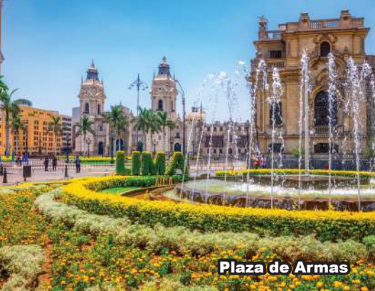
Plaza de Armas