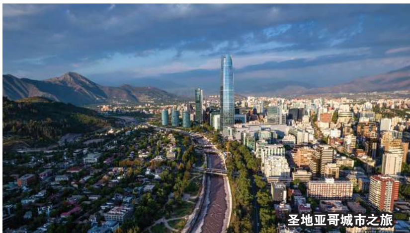
圣地亚哥城市之旅