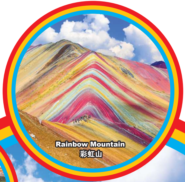
Rainbow Mountain 彩虹山