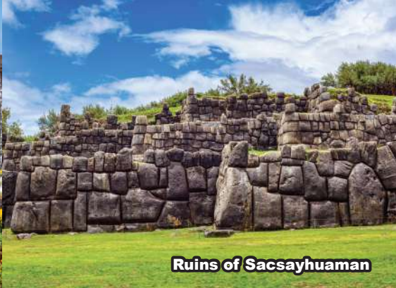
Ruins of Sacsayhuaman