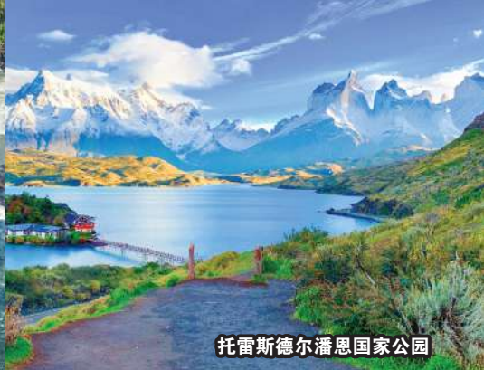
托雷斯德尔潘恩国家公园