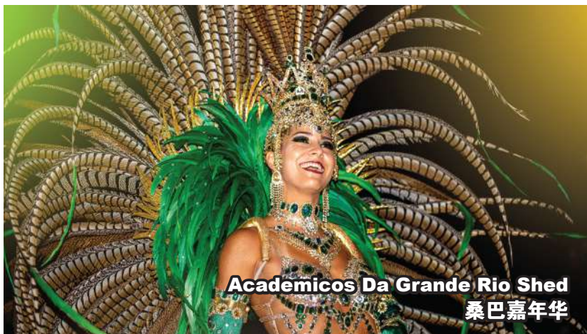
Academicos Da Grande Rio Shed 桑巴嘉年华