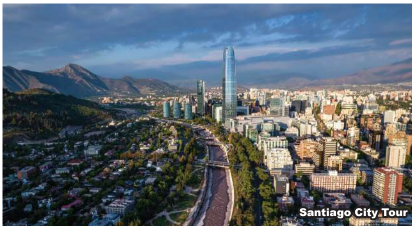
Santiago City Tour