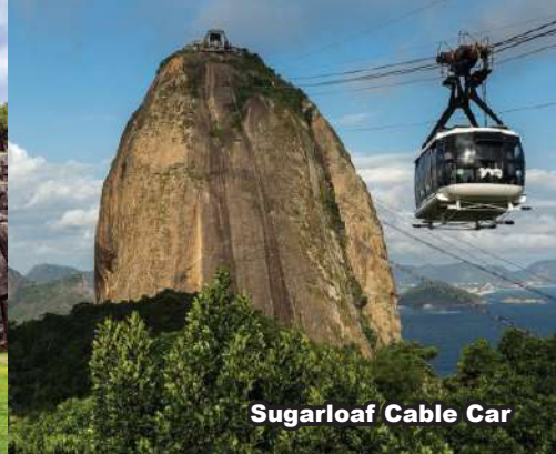
Sugarloaf Cable Car