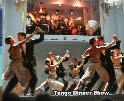
Tango Dinner Show