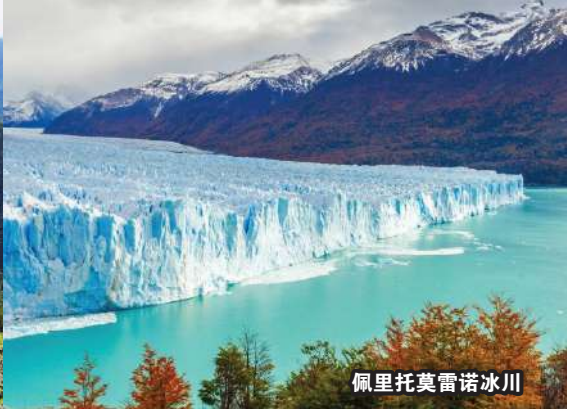
佩里托莫雷诺冰川