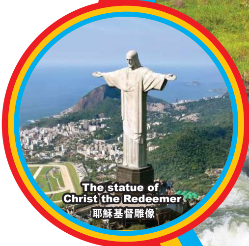
The statue of Christ the Redeemer 耶稣基督雕像