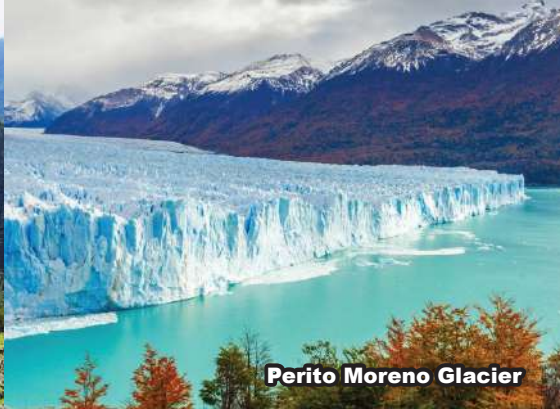
Perito Moreno Glacier