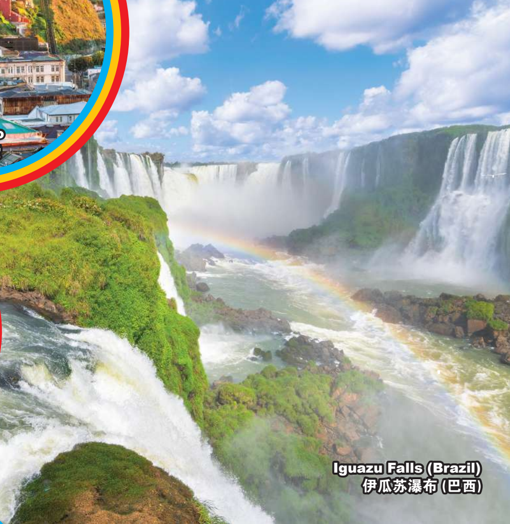
Iguazu Falls (Brazil) 伊瓜苏瀑布 (巴西)

EL CALATATE Aeropuerto Internacional Comandante Amando Tohá de El Calafate Puerto Natales Punta Arenas