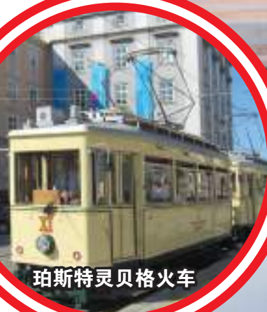
珀斯特灵贝格火车