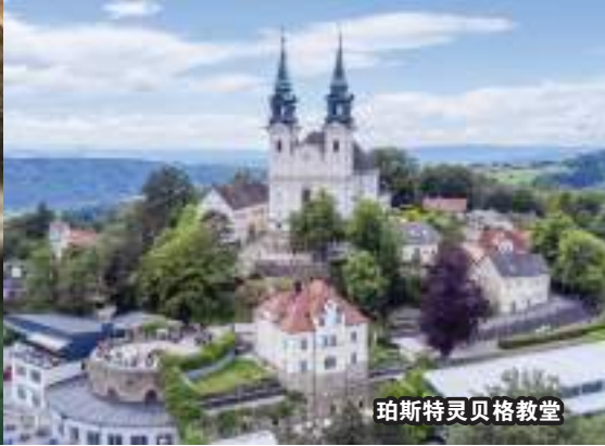
珀斯特灵贝格教堂