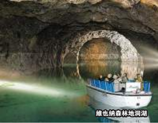
维也纳森林地洞湖