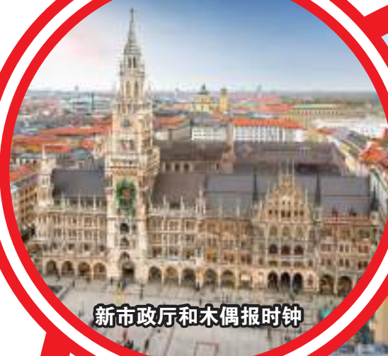
新市政厅和木偶报时钟