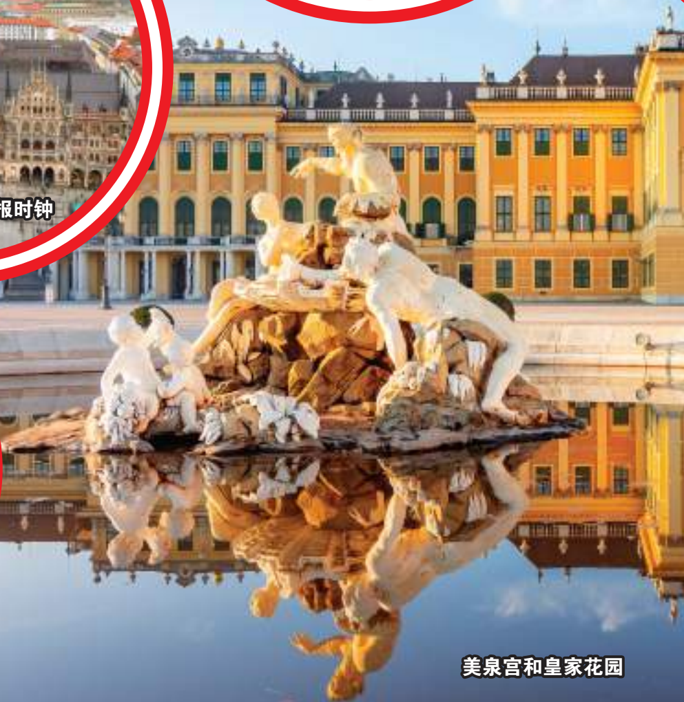
美泉宫和皇家花园