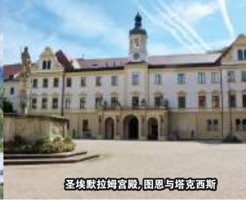
圣埃默拉姆宫殿, 图恩与塔克西斯