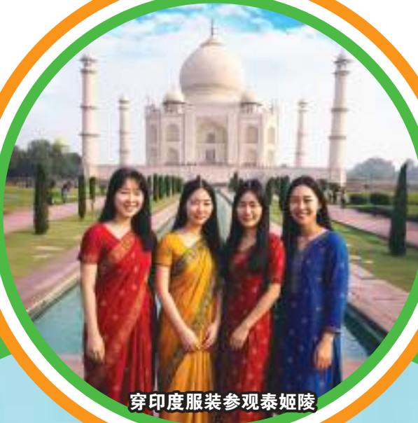
穿印度服装参观泰姬陵