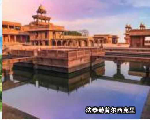
法泰赫普尔西克里