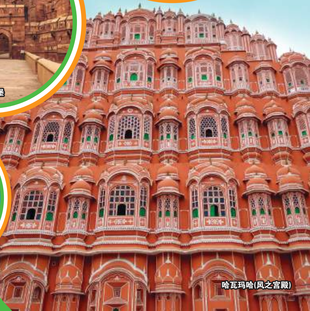
哈瓦玛哈(风之宫殿)