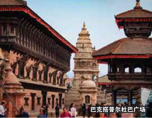
巴克塔普尔杜巴广场