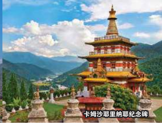
卡姆沙耶里纳耶纪念碑