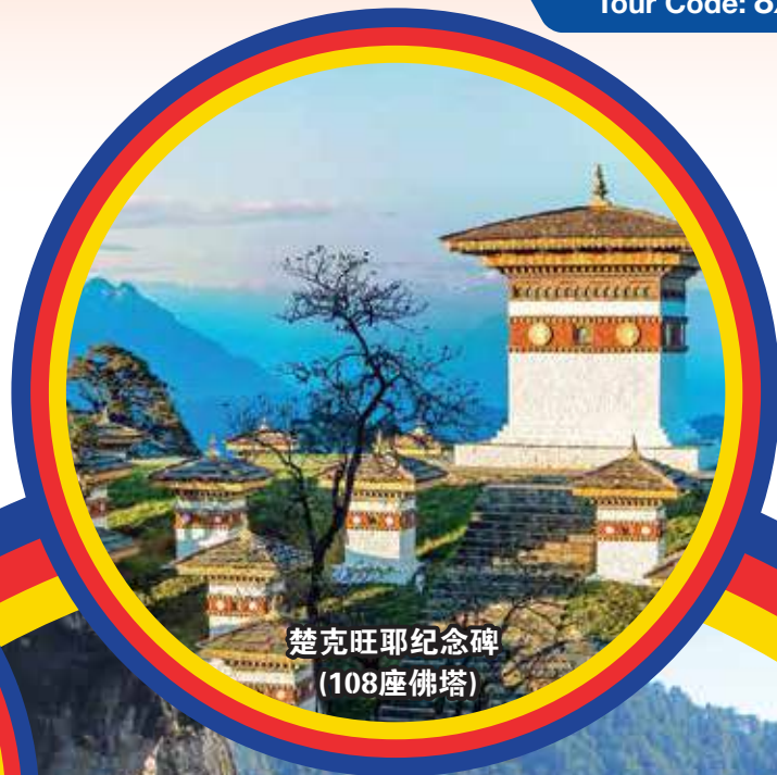
楚克旺耶纪念碑 (108座佛塔)