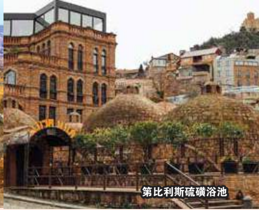
第比利斯硫磺浴池