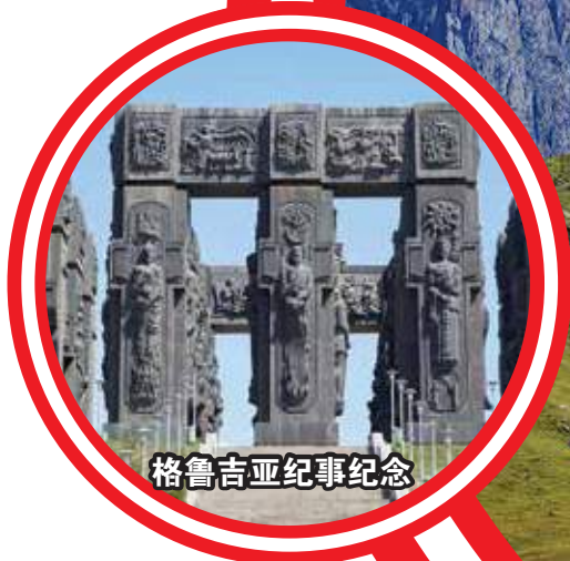
格鲁吉亚纪事纪念