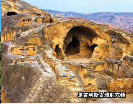
乌普利斯古城洞穴镇