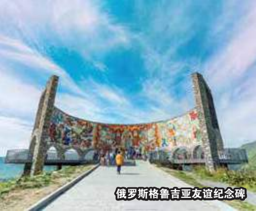
俄罗斯格鲁吉亚友谊纪念碑