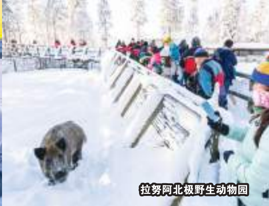
拉努阿北极野生动物园