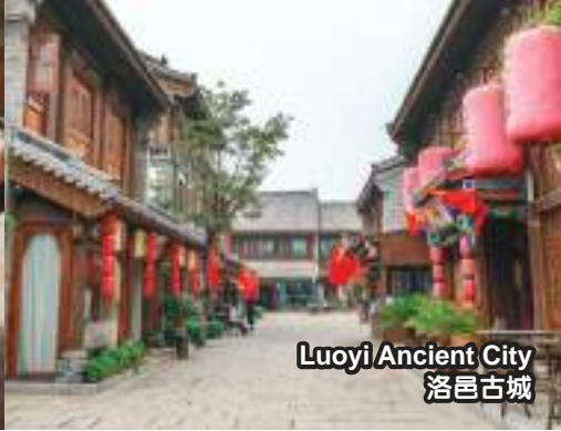
Luoyi Ancient City 洛邑古城