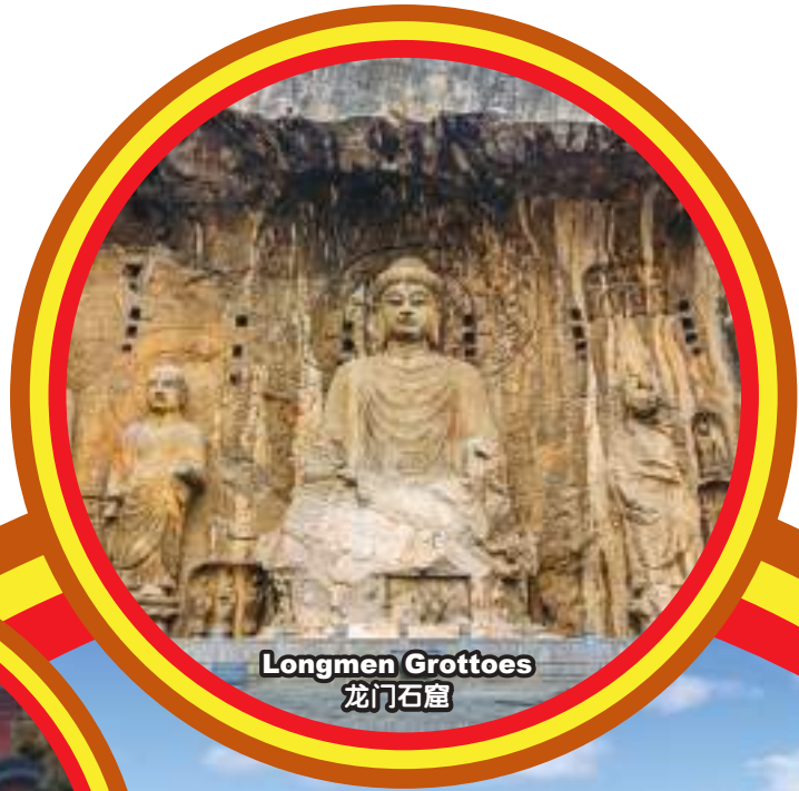
Longmen Grottoes 龙门石窟