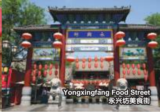
Yongxingfang Food Street 永兴坊美食街