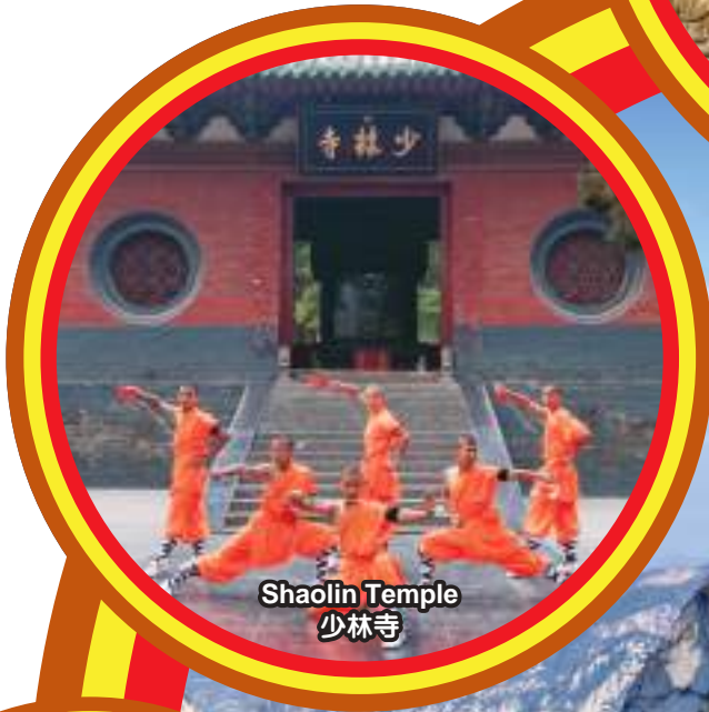
Shaolin Temple 少林寺