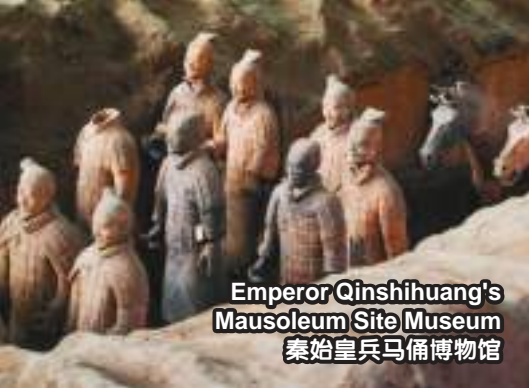
Emperor Qinshihuang's Mausoleum Site Museum 秦始皇兵马俑博物馆