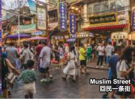
Muslim Street 回民一条街