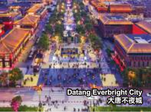
Datang Everbright City 大唐不夜城