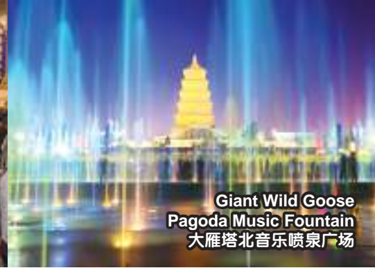
Giant Wild Goose Pagoda Music Fountain 大雁塔北音乐喷泉广场