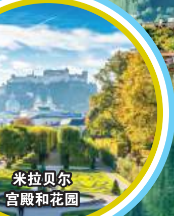
米拉贝尔 宫殿和花园