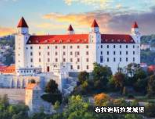
布拉迪斯拉发城堡