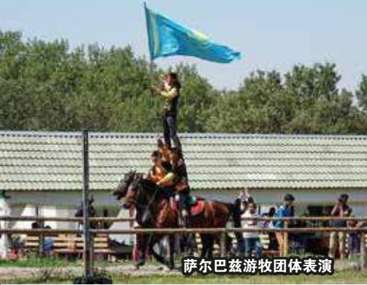
萨尔巴兹游牧团体表演