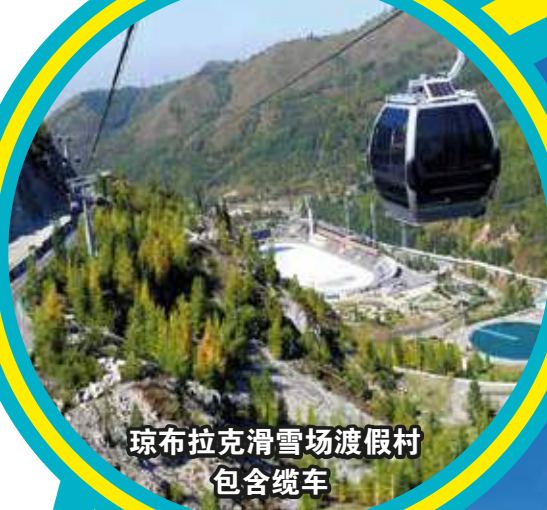
琼布拉克滑雪场度假村 包含缆车