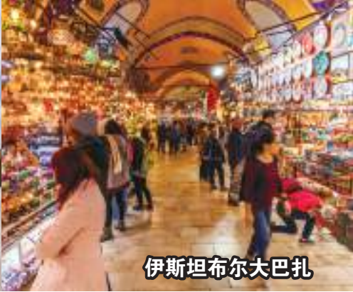
伊斯坦布尔大巴扎